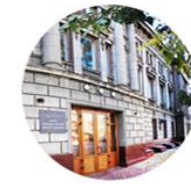
ТНИМЦ СО РАН