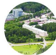
ТНЦ СО РАН